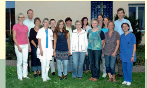
Das Brückenteam: Ärzte und Schwestern des Krankenhauses sowie niedergelassene Ärzte als Kooperationspartner

Alle Krankenkassen in Dresden übernehmen inzwischen die Finanzierung dieser besonderen Versorgung im Rahmen der sogenannten spezialisierten ambulanten Palliativversorgung nach § 37 b SGB V. Nähere Auskünfte erteilen die Mitarbeiterinnen und Mitarbeiter des Teams.