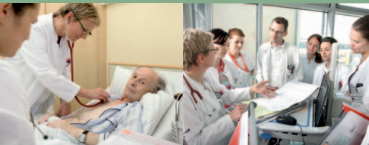
Die Klinik für Innere Medizin untersucht und behandelt Patienten mit allen akuten und chronischen Krankheitsbildern der Inneren Medizin.

Außerdem bereiten wir Patienten mit operationsbedürftigen Krankheiten auf den notwendigen Eingriff vor. Geplante Untersuchungen und Eingriffe können in Abstimmung mit den einweisenden Ärzten auch zunächst ambulant (vorstationär) erfolgen, wobei in Abhängigkeit vom Ergebnis über die stationäre Aufnahme entschieden wird. Ebenso ist es in unserer Klinik möglich, dass Untersuchungen, die den Klinikaufenthalt ergänzen bzw. abschließen, auch ambulant nach der Entlassung (nachstationär) erfolgen. Damit kann der Aufenthalt im Krankenhaus verkürzt werden.