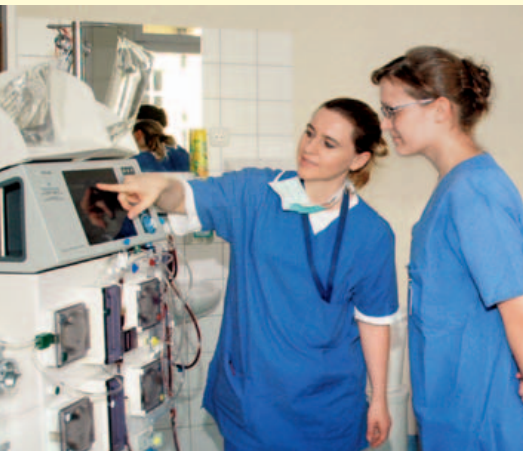
Anleitung auf ITS

Der Berufsabschluss befähigt dich zur weiteren Fortbildung und Qualifikation, wie z. B.