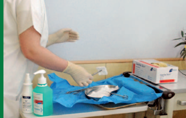
Umgang mit Fachwerkzeug